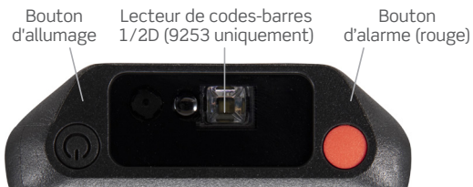
Bouton d'allumage Lecteur de codes-barres 1/2D (9253 uniquement) Bouton d'alarme (rouge)