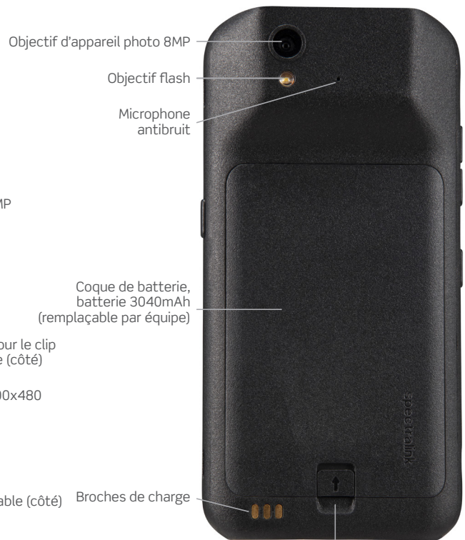
Objectif d'appareil photo 8MP Objectif flash Microphone antibruit